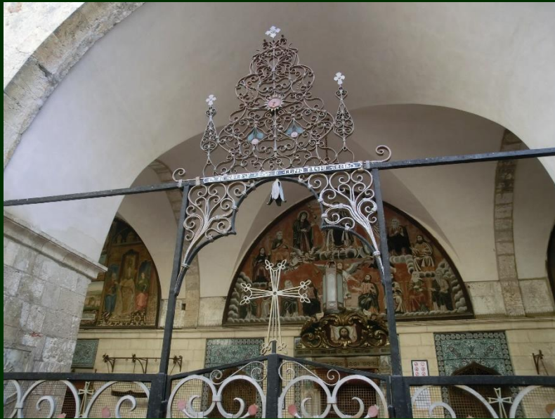
Grabeskirche, Klagemauer und Felsendom auf engem Raum in Jerusalem